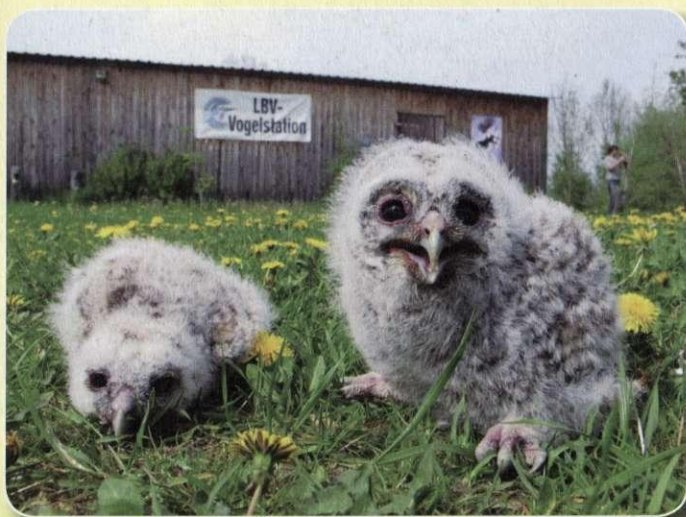
Handaufgezogene Waldkäuze in der LBV-Station Regenstauf

Greifvögel und Eulen müssen lernen, lebende Beute zu schlagen. Dies ist sehr aufwändig, so dass man sich am besten um die Aufnahme in professionellen Pflegestationen bemüht. Auch bei jungen Enten und Gänsen wenden Sie sich bitte an eine Vogelauffangstation oder einen Tierarzt. Adressen sind über den LBV und die Landratsämter zu erfahren.